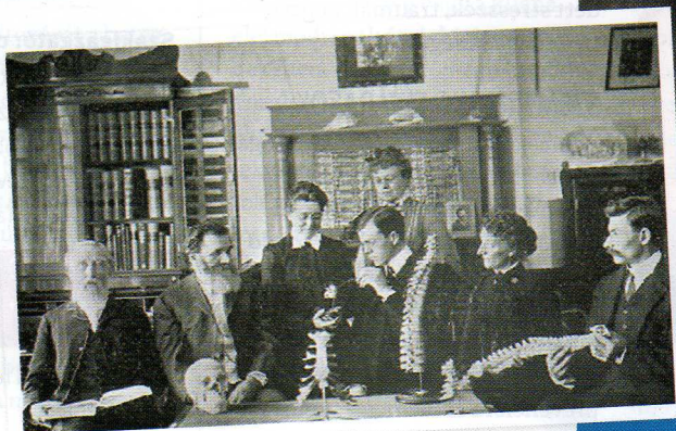
Palmer tanítványai körében

40 éves korában, 1885-ben kezdte meg kézzrátételes gyógyítói praxisát Davenportban (Iowa állam), amelyet sikerre is vitt. Pár helyiségből álló bérelt rendelője az évek során 40 szobás kórházzá nőtte ki magát, majd 1896. júliusában bejegyeztette vállalkozását Kiropraktőr Iskola és Kórház néven. Első tanítványát 1898-ban kezdte el képezni, 1902-ig tizenkét kiropraktőr tanítvány került ki a kezei közül. Iskolájának oklevelét azok